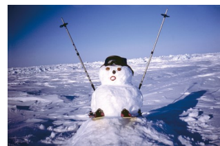
<北極点の雪だるま>