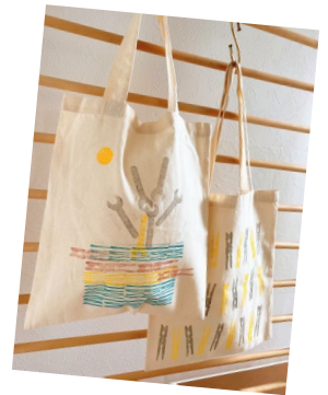
マイバッグイメージ