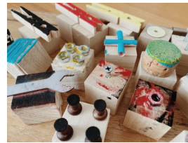
スタンプいろいろ!

日 時 : 8月7日(日) 午前10時~正午、午後1時~3時 会 場 : 直江津図書館2階 こどもとしょじつ 定 員 : 50名(申込不要) ※無くなり次第終了 参加費 : 190円 問合せ : 直江津図書館 ☎025-545-3232